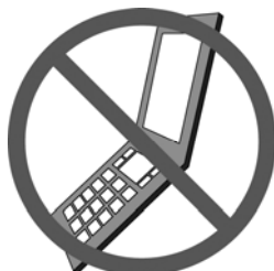
携帯電話は館外で

サインペンやボールペンなどのインクは作品に付着すると落ちません。また、シャープペンも芯が折れて飛びますので不適切です。筆記具は、鉛筆をご用意ください。下敷もあると便利です。