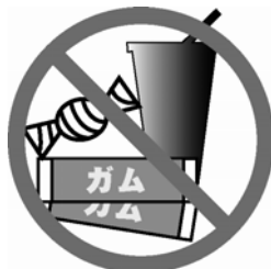
飴、ガムなど食べ物を飲食しない