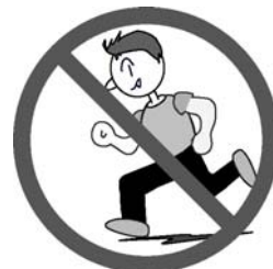
走らない、騒がない