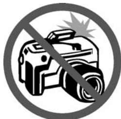
カメラ、ビデオなどで撮影しない

破損の原因になるだけでなく、手の油や汗などが作品につくと、後で化学変化を起し、変色やカビが発生します。