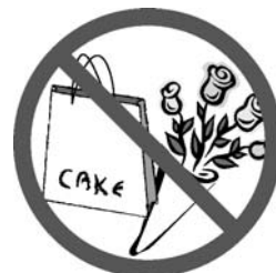
植物、食べ物を持ち込まない

作品にぶつかるおそれのあるものは、展示室に持ち込まないで下さい。傘立てや、コインロッカーをご利用ください。ロッカーに入らない場合は、受付にてお預かりします。