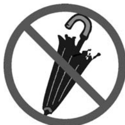
カサなど大きな物を持ち込まない

他のお客様の鑑賞のさまたげになりますので、展示室内での携帯電話のご使用はお控えください。展示室内では、電源を切るか、マナーモードに設定してください。