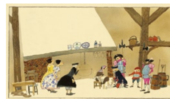
「シンデレラ」より ©空想工房